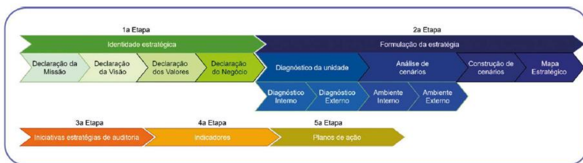
Figura 2 – Fases da elaboração da estratégia