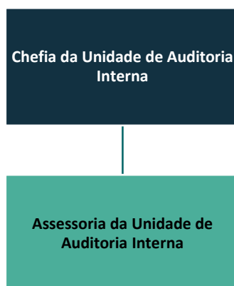
Figura 1 – Organograma AUDI 2024

Após promulgação da Lei Estadual nº 21.811/2023, e com a edição do Decreto Judiciário TJPR nº 592/2024 (Regulamento Administrativo), a Unidade de Auditoria Interna foi reestruturada e passou a ser representada pelo organograma da Figura 1 :